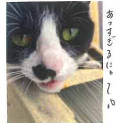
お尻を覗いてみる。@sakiis 3