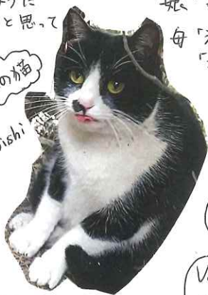
会社の猫 insta @sakoishi

年始、S社家のお母さんはお昼に かけうどんを作りました。 だしは市販のめんつゆにかつおがしをいれる簡単 メニューです。 父「今日は変わった味のうどんなんだ。 酒の味がする」 娘「変わった味ってだいたいおいしくないよわ！」 母「えっ？いつもと一緒によ」「うわ、あまら！！ 「もしかしてめんつゆじゃなくてみりん？」 なぜか、めんつゆのボトルの中身はみりんに なっていました！ 15分後、娘「母さん酔った？」 母、真赤な顔でお血洗いしました。 (家族は文句言わずに食後してくれました) やさしい家族に感謝です。