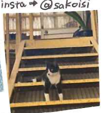
insta → @sakoisi