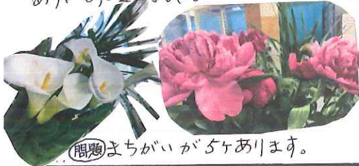
問題まちがいがあります。