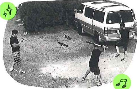
(常務率いる草野球チームで活躍する三象です)

9月上旬、残暑が徹しく作業していても汗だくになる頃。夕方、場内の機械は止まり静かになり、作業員さんもお疲れを返したかな～と思いきり外をのぞくと、駐車場で野球談議がはじまってました。(笑)