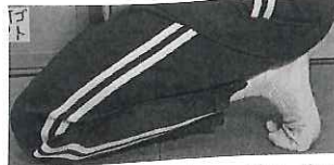
正座でしびれた足を治す方法