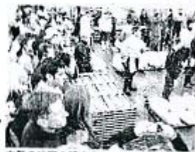
大勢の外国人観光客でにぎわう築地市場

仰天の1位! 築地市場 マグロの競りで活気ある水、 ついでにスシも食べられて 人気です。